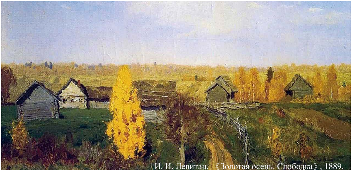
И. И. Левитан, «Золотая осень. Слободка», 1889.

Graduate Institute of Russian Studies College of International Affairs